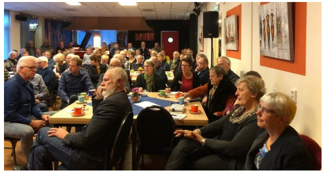
Grote belangstelling, de zaal zit helemaal vol.